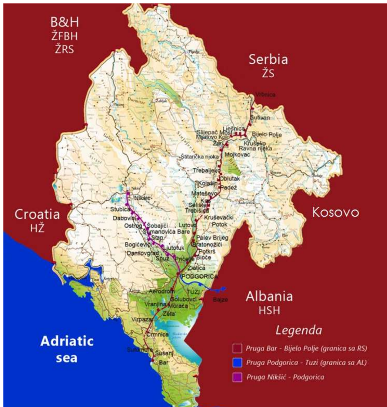
Prilog 2. Pregled mreže željezničkih pruga u Crnoj Gori